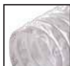
Белый ( )